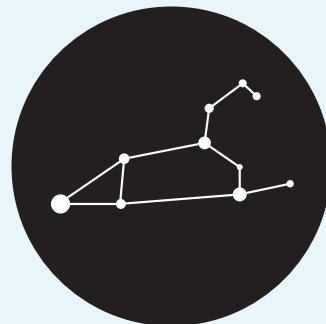
Representación de un geoplano de la constelación Leo