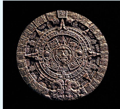
Piedra del Sol, un monolito que refleja la cultura mexicana

Una vez terminado el intercambio de ideas con sus compañeros, para su proyecto final unos estudiantes decidieron crear un drama integrando las creencias de los astrónomos aztecas del siglo XVI y las de los astrónomos de civilizaciones occidentales del siglo XVIII. Otros decidieron hacer geoplanos de las constelaciones y explicar los animales mitológicos para enseñar a las otras clases bilingües.